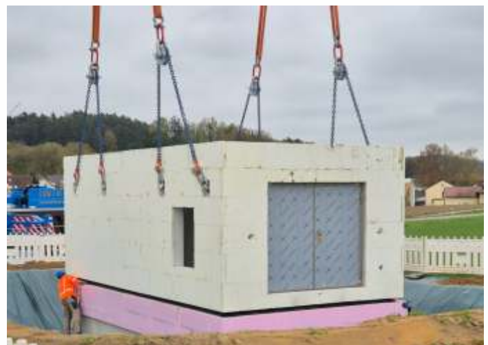
Bilder und Text: Florian Schröder, Markt Hohenwart

Der Neubau der Druckerhöhungsanlage kostet dem Zweckverband weitere 1,5 Millionen Euro. Diese Kosten, die bereits teilweise über das Maßnahmenpaket III bezahlt wurden, müssen laut Verbandsvorsitzenden über Verbesserungsbeiträge finanziert werden. Aktuell werden derzeit von der Verwaltung die Kosten aus dem Maßnahmenpaket II zusammengetragen und mit einem Kommunalberatungsbüro für die Berechnung der Schlussrate des Verbesserungsbeitrags vorbereitet.